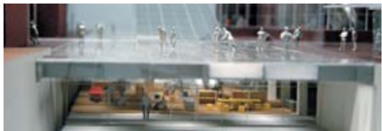
Tokyo Arts and Disability Center 障害者芸術活動の拠点施設を核とした美術館の設計 / 黒川泰孝