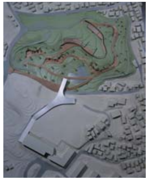
野毛山動物ミュージアム 小規模動物園の自然学習拠点としての再生 / 飯山千里